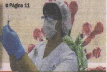
o Página 11